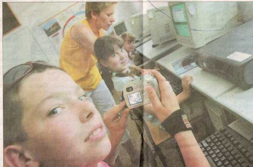
Na razie z komputerów od Billa Gatesa korzystają dzieci, jesienią będą się na nich uczyć dorośli